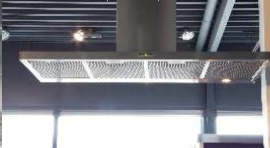
PSX eilandschouw | PSX1206ES | afm. 120x60x4cm