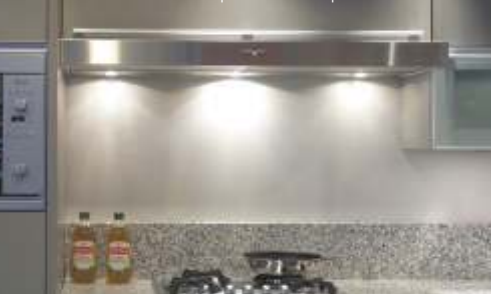
PSH wandschouw onderbouw | PSH1205WS | afm. 120x50x8cm